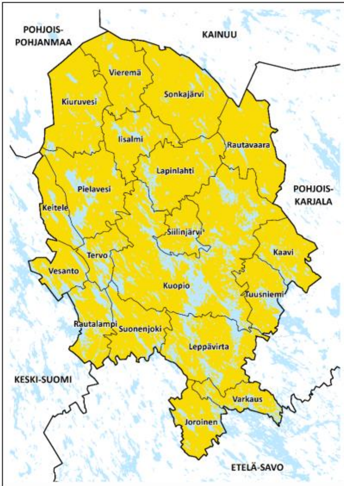
Kuva 1. Pohjois-Savon maakuntakaava 2040, 2. vaiheen suunnittelualue ja ympäröivät maakunnat.